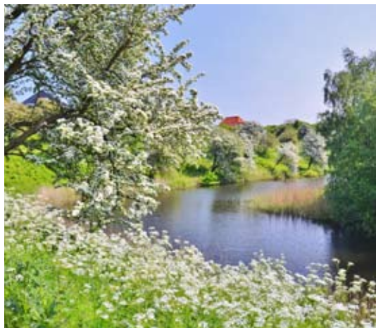
Fredericia vold en smuk forårsdag, alt er i grøde.

Også forårets fremspirende ukrudt har sin plads i naturens grundlæggende og helt fantastisk sammenhængende funktion.