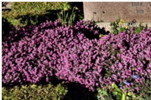
Blandt mange gode planter for insekter er de smukke lyngarter.