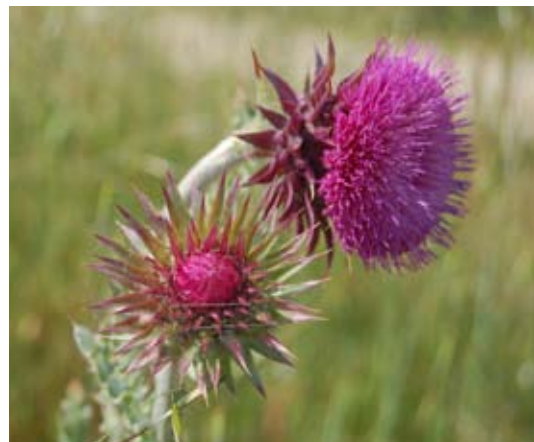
Blandt de meget ”udsældte” ukrudtsplanter er tidsler og mælkebøtter på grund af deres store spredningsevne.