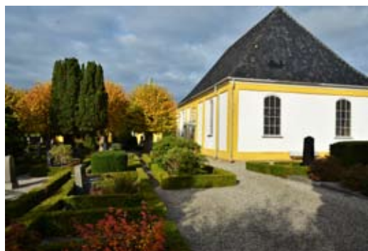
Også på Reformert Kirkegård skal store arealer med ral renholdes året rundt.