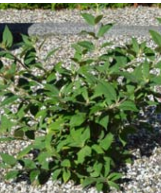
En blomsterbusk fra juleaften 2019.

I 2020 leverede menighedsmedlemmer fra Ærø, som nævnt i blad 3. 2020, en mængde blomstrende planter til samme formål. Om foråret bliver der, som omtalt i blad nr. 3, 2021, nu i stedet for stedmoderblomster plantet hornviol, som ligner til forveksling, men har meget mere ”insektføde”.