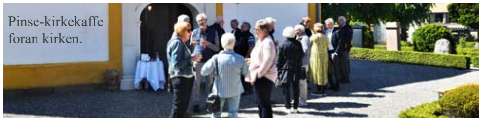
Pinse-kirkekaffe foran kirken.

Siden seneste blad har vi modtaget følgende bidrag: L.B. 200 kr. - B.K.S. 500 kr. Tusind tak, det glæder os meget.