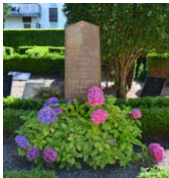
En af de mange planter som kom fra Ærø.

Vores kirkegårdsgartner er blevet bedt om, at vente med at klippe ligusterhækken til den er afblomstret. Hækkens blomster er nemlig, som det fremgår af bladets forside, meget eftertragtet af de vigtige insekter. Alt sammen gøres for at skabe gode levevilkår for en mangfoldighed af insekter.