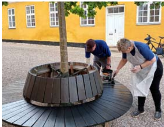
Bænken omkring Zwingli Egen er males sort.