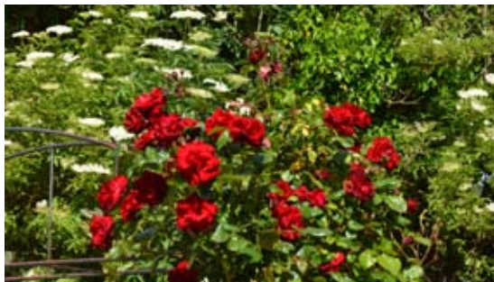
Gunnar har fældet buske og bygget insekthotel bag rosenbuen og hyldetræet.