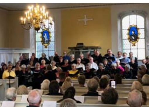
De 55 sangere i fælleskoret fyldte Reformert Kirke med flotte stemmer 5. maj.