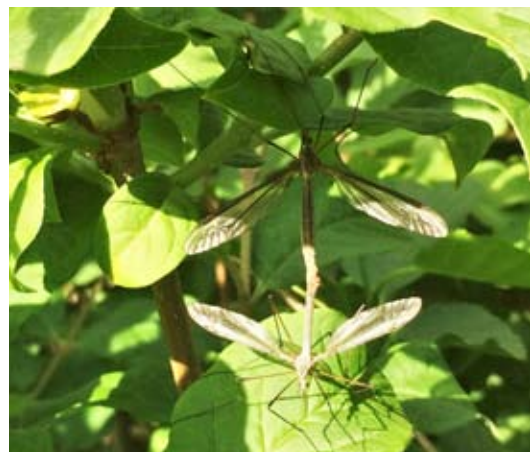
Insektformering på et skyggefuldt sted.