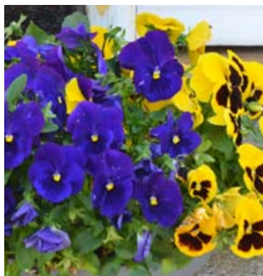
Hornvioler findes i mange farver og ”mønstre”.