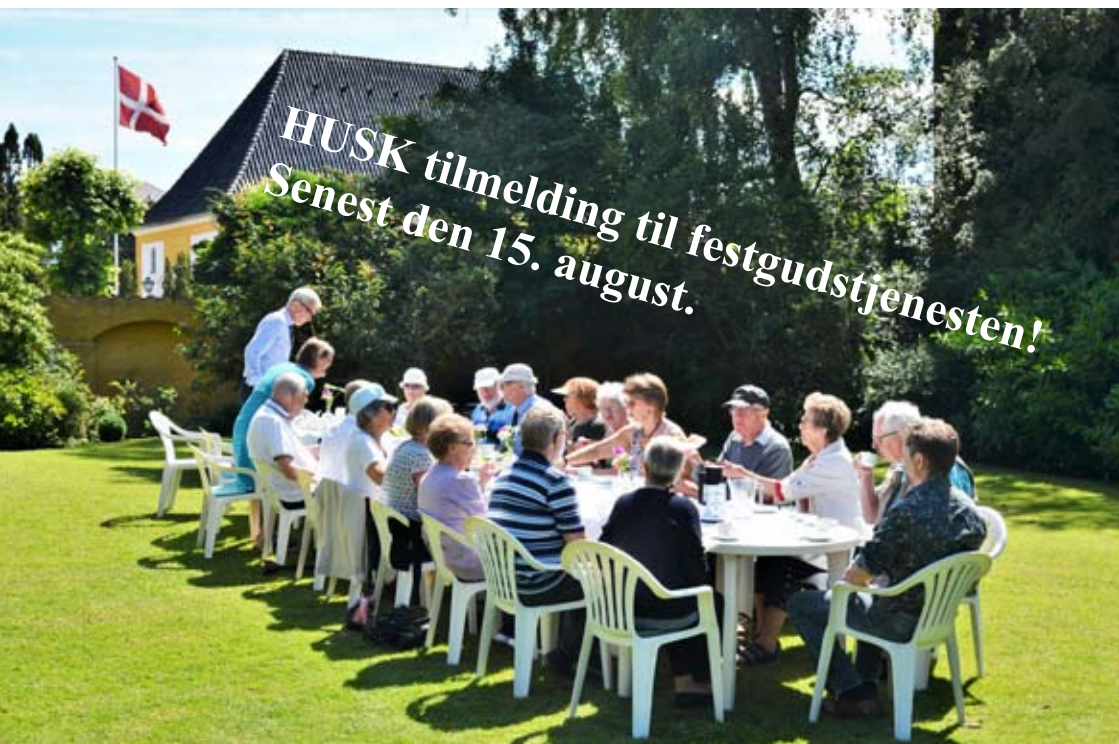
Kirkekafe i "Præstegårdshaven" den 23. juni 2019.

Nr. 3. August - September - Oktober 2019