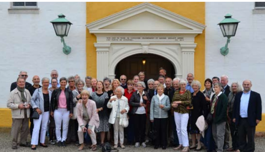
De mange gæster og en del menighedsmedlemmer foran Reformert Kirke den 27. august 2017.