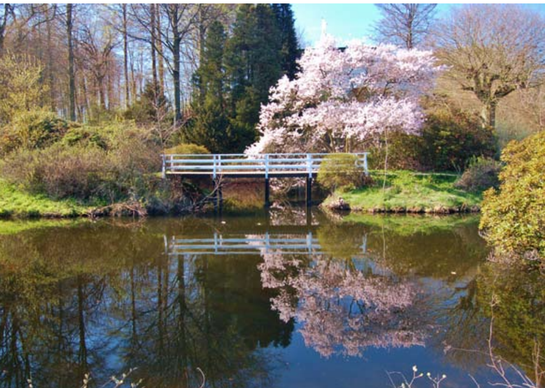
Forår i Hannerup Skov.