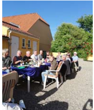
Sommervejret gjorde en hyggelig grillaften ekstra fin.