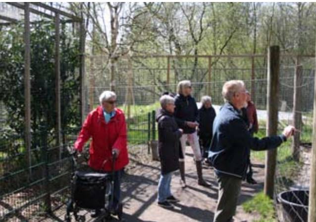
Stemmingsfoto fra en vellykket udflugt til Skærup Zoo den 2. maj.