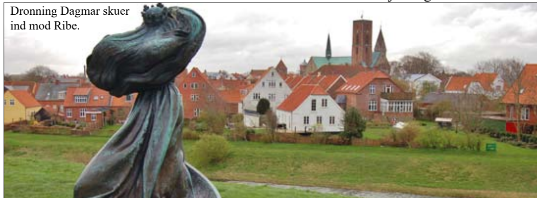
Dronning Dagmar skuer ind mod Ribe.