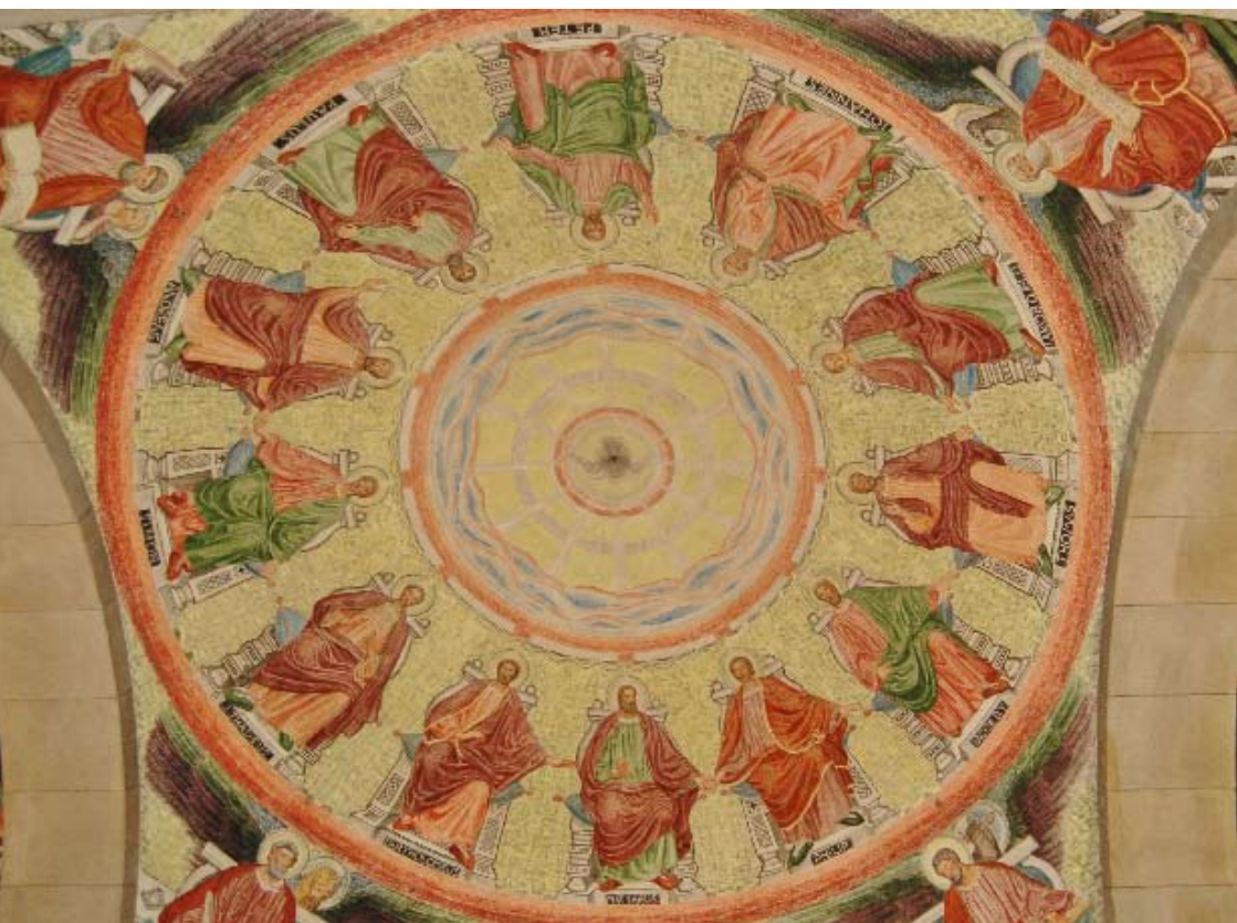
Fra Viborg Domkirke, Joakim Skovgaard. Apostlene.

Nr. 3. August - September - Oktober 2016