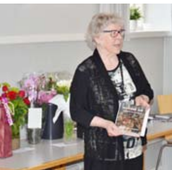
Herdis Frahm Honoré: "Rottens Øje" Udkom den 18. maj.