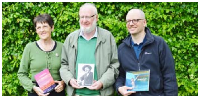
Rosa Engelbrecht Morgen Tanker